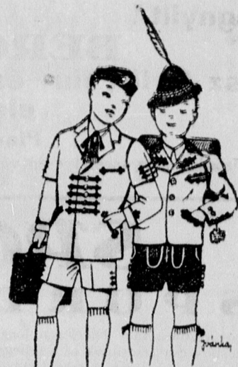
Vigan járnak iskolába Grünfeldtől kapott ruhába jó anyagja, szép szabása, Alig pár pengő az ára!