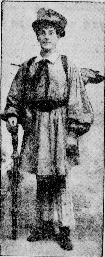
A sírig tartó szerelem hőse: Alexander Girardi, a Burgtheater Straubinger c. operett főszerepében

Schrátt Katalin napokig sírt. Lemondta az előadást, a próbákra nem ment el, sőt — komolyan foglalkozott azzal a gondolattal, hogy végleg elhagyja Bécsét s megválik a Burgtheatertől.