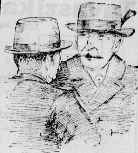
— Milyen volt a tavalyi termés? — Hál' Isten nem panaszkodhatom, a fölöslegből most adtam el, mert a fiam minden áron egy Orion rádiót akar venni. Unja már a dektorást.

Tarján Oszkár sok humorral és nagyon szellemesen köszöntötte fel a hölgyeket és kifejtette, hogy a debreceni SOS voltaképpen KSS-nek hangzig: Kölcsonös Segélyző Somlyay.