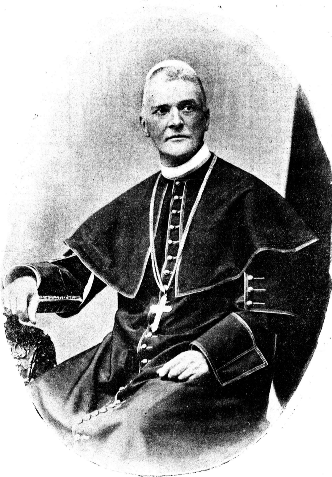
SZMRECSÁNYI PÁL, nagyváradai püspök.

észrevelte, hogy a mostoha viszonyok vándorbotot nyomnak a nép kezébe s mind többen és többen vitorláznak át az óceánon új hazát keresni, az illetékes körök figyelmét felhívta e sajnálatos jelenségre és élére állt annak a bizottságnak, melyet a magas püspöki kar a kivándorlás lehető megakadályozására és a