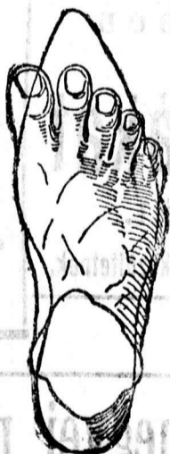
A láb helytelen cipőnél