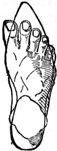
A láb helytelen cipőnél