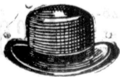
14 korona divatos formában

Cipők és csizmák a legtartósabbak. Ingek, nyakkendők, téli sapkák és keztyűk rendkívül olcsó árban.