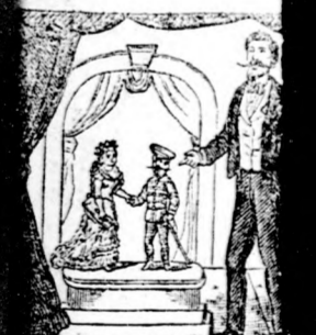
1 éves, 28 hüvelyk 3 éves, 29 hüvelyk

* Mint értés. nképző egyesülete. gja szökött nyári tán. * Népiunepély. os népiunepély a ke. kerületnek és érde. ámtalan sátor van. ombokból, s többek