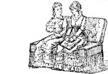
mint két támlás szék,

Szabadalom Magyarország-Ausztria részére 17550. és 18857. Használható nappal mint pamlag.