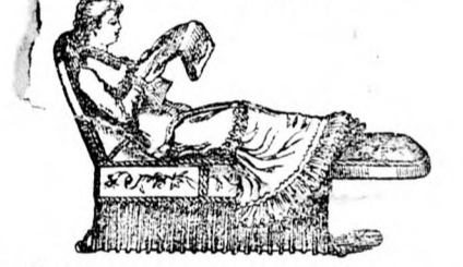
éjjel pedig kényelmes 2 méter hosszú és 1 méter széles matracos ágyanak.