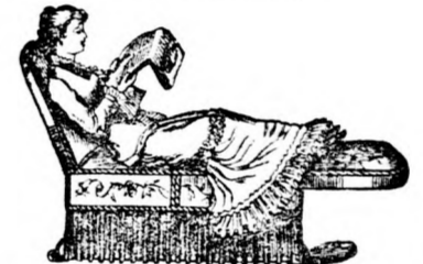
éjjel pedig kényelmes 2 méter hosszú és 1 méter széles matracos ágyak.