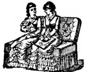
mint két támlás szék,

Szabadalom Magyarország-Ausztria részére 17550. és 18857. Használható nappal mint pámlag,