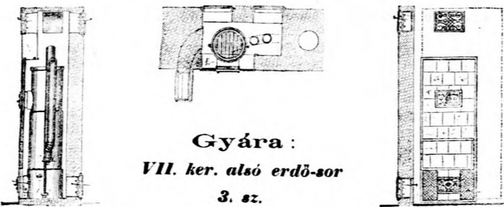
Gyára: VII. ker. alsó erdő-sor 3. sz.

Ajánlja szabadalmazott, zártalan, önmagukat felhuzó zárdőnyeit hullámszűrt aczellemzéstől; továbbá szabadalmazott Blazicek- és Brecka-féle töltő és szel- lőztetési