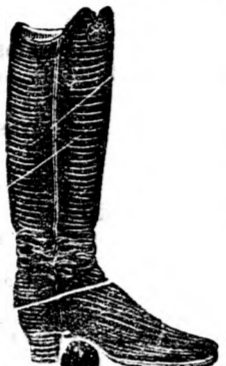
Az arany csizmához

A nyári idény vége felé járván, a még raktáron lévő női, férfi és gyermek cipő árakat tetemesen leszállított áron