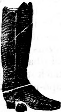
Az arany csizmához.

Iparhatóságilag engedélyezett üzletelhagyás miatti