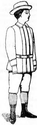
Gyermek Costüm 5 frt és feljebb.