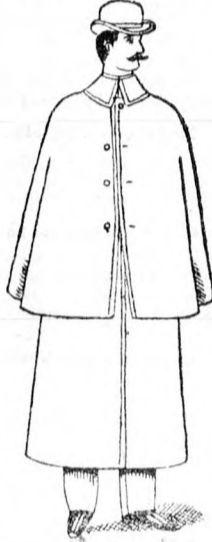
Utazó köpeny 17 frt és feljebb.