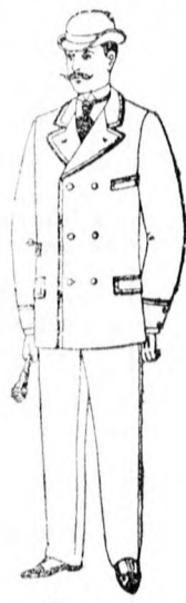
Öltöny 13 frt 50 kr. és feljebb.