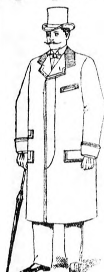
Téli felöltő 18 frt és feljebb.