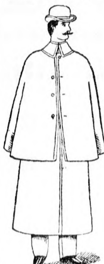
Utazó köpeny 17 frt és feljebb.