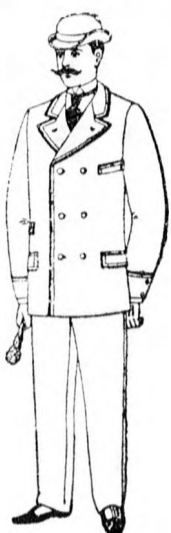
Öltöny 13 frt 50 kr. és feljebb.