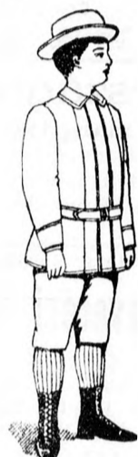
Gyermek Costüm 5 frt és feljebb.