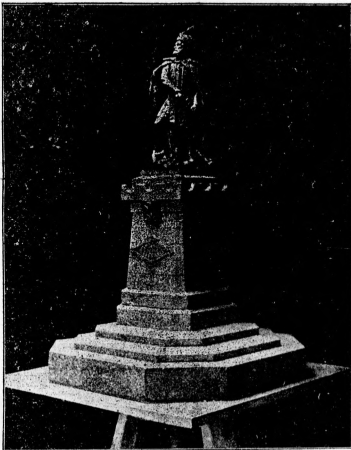
Mintázta: Tóth András debreczeni szobrász.

És a mint a millenniumi képekre nem sajnáltak megszavaztatni százakat, úgy eszobor alaptól se vonják el azt. S ha Bószörmény előjárósága, népe fukar vagy közönyös, Nánás vagy Szoboszló legyen, mely nemes hévvel, fáradhatatlan kovácsolójává lesz a tervnek, mert nem az a fő, hogy melyik városban áll a Bocskai-szobor, hanem hogy álljon végre már s hiánya ne legyen örökös, égő szégyen folt büszke hajdu nevünkön.