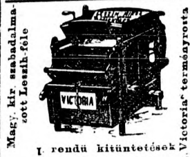
Magy. kir. szabadalmazott Leszih-féle

Az ezredéves országos kiállításon allami éremmel kitüntetve!