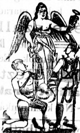
Utánzás ellen védve 16302. sz. a.

Részletes képes ír- jegyzék ingyen és bér- mentve.