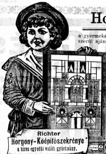
Richter Horgony-Kőépítőszekrény a híres egyedül valódi gyártmány.

Iroda és raktár: I., Operng. 16. Bécs (Wien) gyár: XIII/1 (Heitzing.) Rudolstadt, Nürnberg, Olten (Svájc) Rotterdam, New-York, 215 Pearl-Street.