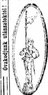
Védjegy „Vas lovag”

a törv. bej. „vaslovag” védjeggyel a legjobb és legtartósabb puha padlóknak és konyhabutoroknak bemázolására. Bejegyzett Az Eisenstädter-féle