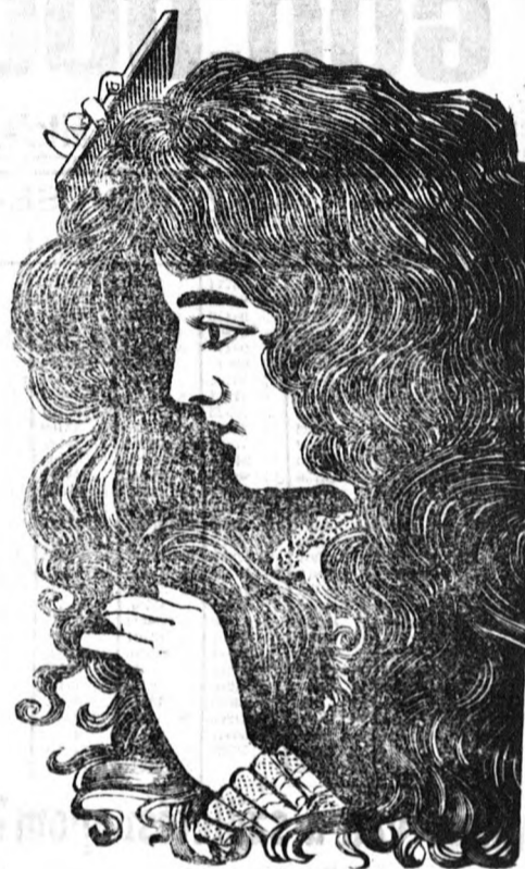
Nincs kegyelem a korpá, a hajhullás a kopaszágnak, mint azt a fenti kép mutatja.

Az anya vagy gyermekek betegsége gyakran paralizálja a hajlót és évek mulnak, míg a természet ezt a hiányt pótolja De ki kételkedhetnék ezen csodálatos szer tulajdonságaiban akkor, midőn kezünk között ezer és ezer bizonyító levelet van, melyek oly egyénektől erednek, kiknek szavahihetőségéhez kétség nem fér.