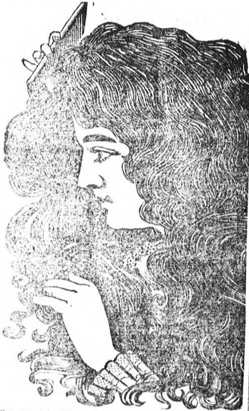
Nincs métség többé a kopra, a hajhullás a kopaszságnak, a mint azt a fenti kép mutatja.

Nincs semmi ok arra, hogy önnék vagy gyermekeinek ritka és csenevész hajnövése legyen. Az egészséges hajra, mint védőre, úgy télen mint nyáron szükség van és egészséges hajnövés nélkül úgy a gyermekek mint a felnőttek folyton ki vannak téve a meghűlésnek. Az anya vagy gyermekek betegsége gyakran paralizálja a hajtot és évek mulnak, míg a természet ezt a hiányt pótolja. De ki kétkelhetné ezen csodálatos szer tulajdonságaiban akkor, midőn kezeink között ezer és ezer bizonyító levél van, melyek oly egyénektől erednek, kiknek szavahihetőségéhez kétség nem fér.