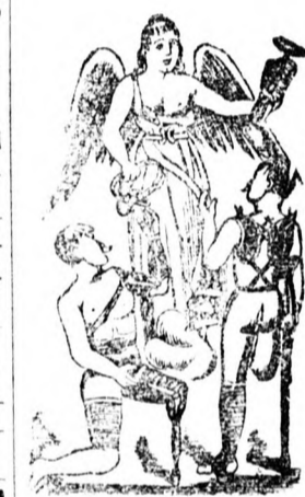
Utánzó ellen vedve 16307 sz.

sib. a legjobb minőségben jutányosan beszerezhetők. Nagy kepes árjegyzék ingyen es bérmentve. Feau címre figyelni tessék.