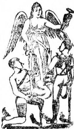
Utánnévelő védve 1887 sz.