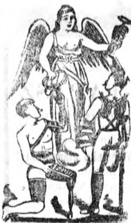
Utánzás ellen védve 16807 sz.

stb. a legjobb minőségben jutányosan beszerezhetők. Nagy képes árjegyzék ingyen és bérmentve. Fenti címre ügyelni tessék