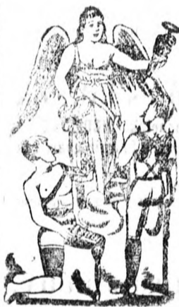
Utánzás ellen védve 16307 sz.