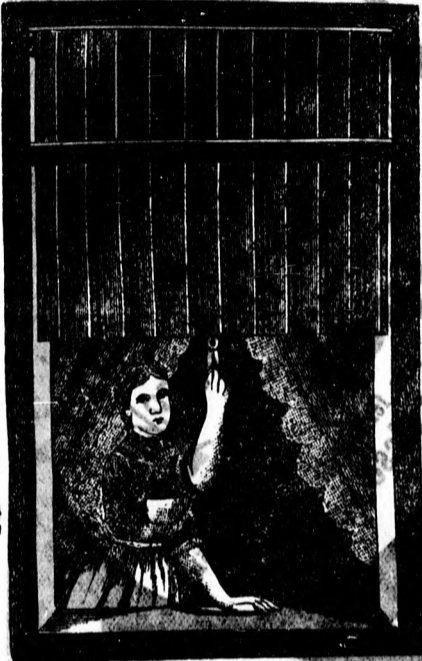
Tartósságot 10 évig kezeskedem.

Diszkrétokat a legszebb és legizlésebb kivitelben eszközöl.