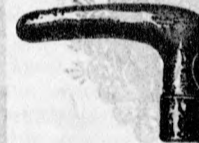
4199 ezüst ébenfa, v. borsfával 6 frt.

szébbnél szébb ujdonságok állandóan raktáron.