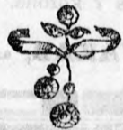
4058 szám. Arany opál türk. kís v. gyöngyel 4 frt. 50. gyé- mánt 25 frt. brilliánt 100 frt.