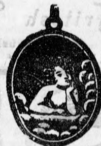
151 sz. doublé 4 frt. kisebb 1 frt. 50. arany 8 frt. kisebb 3 frt.