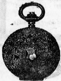
1 szám. Ezüst 6 frt 50. 14 kar. arany 18 frt.