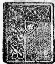
4103 szám. Ezüst 15. frt. arany ezüst 5 frt.