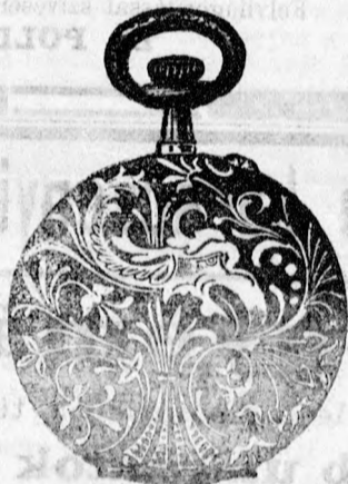
42 szám. acél 5 frt. ezüst 7 frt. arany 30 frt.