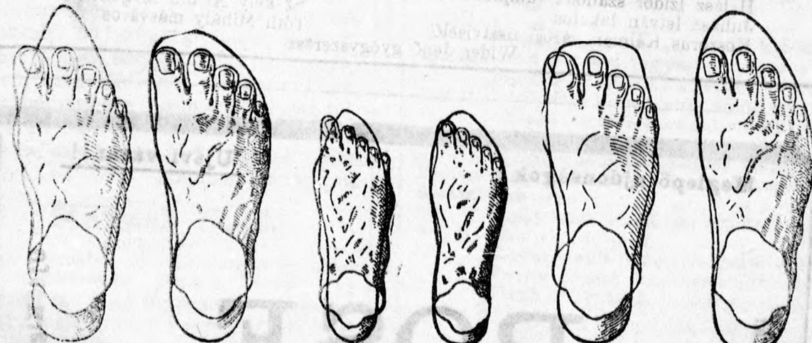
Hibás lábbeli, eltorzult láb. AMERIKAI CIPŐ. Helyes láb. Hibás lábbeli, fájós láb. Amerikai cipő, egészséges láb. Hibás lábbeli, nehézkes járás. AMERIKAI CIPŐ. kényelmes járás.

Amerika, a haladás és a praktikus fejlődés hazája hosszú kísérletezés és alapos tanulmányozás után megtalálta a cipő helyes alakját, nemcsak a talpét, hanem felsőrész szabását is miáltal Amerika meghódította cipőinek a világpiacot.