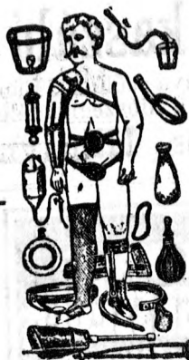
Györfi Sándor Simonffy-u. Béraház.

Haskötő, sérvkötő, hát egyenesítő, gummi harisnya, irrigátor, mindennemű fecskendő, szuszpenzorium, francia és amerikai gummikülönlegesség nagyraktára. Gallér, kezelő nyakkendő, kötött kesztyű, fésű, kefe, szappan, parfüm, harisnyakötő. A t. közönség b. figyelmébe ajánlja.