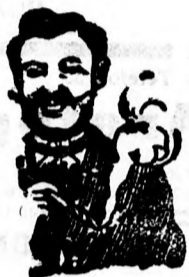
EGGER-mellpasztilla csakhamar meggyógyított.