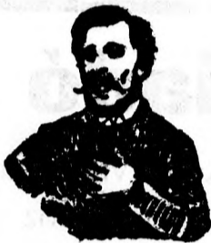
Megfojt ez az átkozott köhögés.

Köhögés, rekedtség és elnyálkásodás ellen gyors és biztos hatásuk az