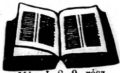
Móz. I. 8, 9. rész.