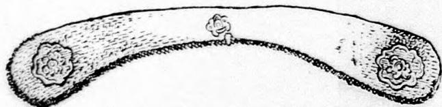
Pártá tū a 3. sz. sírből.

De nem volt férfi csontváza, tehát a Patai uramé sem lehetett, a vele délfelől szomszédos majdnem egé-szen elporladt 3. számú sem, amit a porrá vált koponya helyén fekete hajszálakkal együtt lelt cifra réz pártá tū