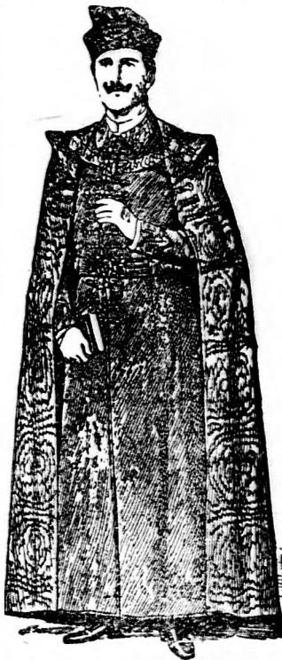
„Orlé” ornátus szállító

Cégem eddig 5000 palástot szállított s munkáimért a legnagyobb haszon és jutalom az elismerőlevelek voltak. Kérem a négyesületek hasonló ajándékrendeléseit.