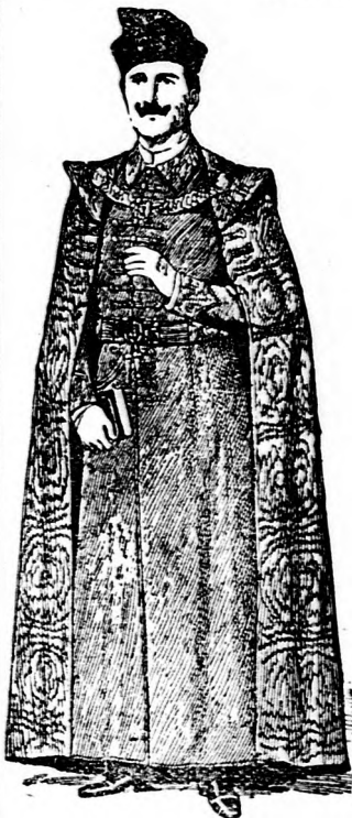
„Orle“ ornatus szállító

Cégem eddig 5000 palástot szállított s munkáimért a legnagyobb haszon és jutalom az elismerőlevelek voltak. Kérem a nőgyesületek hasonló ajándékrendeléseit.