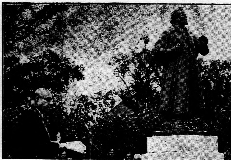
Méliusz Juhász Péter szobra.

Nem hiszem azonban, hogy tévednek s tárgyilagos alapon szemrehányás érhetne azért a megállapításért, hogy e hazában a keresztyén műveltséget Melíuszék reformátori munkássága tette igazán magyarrá. A katolicizmusnak örök érdeme marad, hogy a keresztyén-ség nyugati formáját meghonosította az országban. A keleti elmaradottság és byzantinizmus állapota mutatja, hogy milyen nagy dolog volt ez! Magyar népünk a nyugati keresztyéniséggel együtt ápolója lett a nyugati műveltségnek s Szent István, Szent László, Nagy Lajos és Mátyás király kultúrafeljesztő törekvései, fényes eredményei soha el nem múló dicsőséggel beszélnek róla, hogy milyen páratlan érzékkel és hivatottsággal volt előharcosa