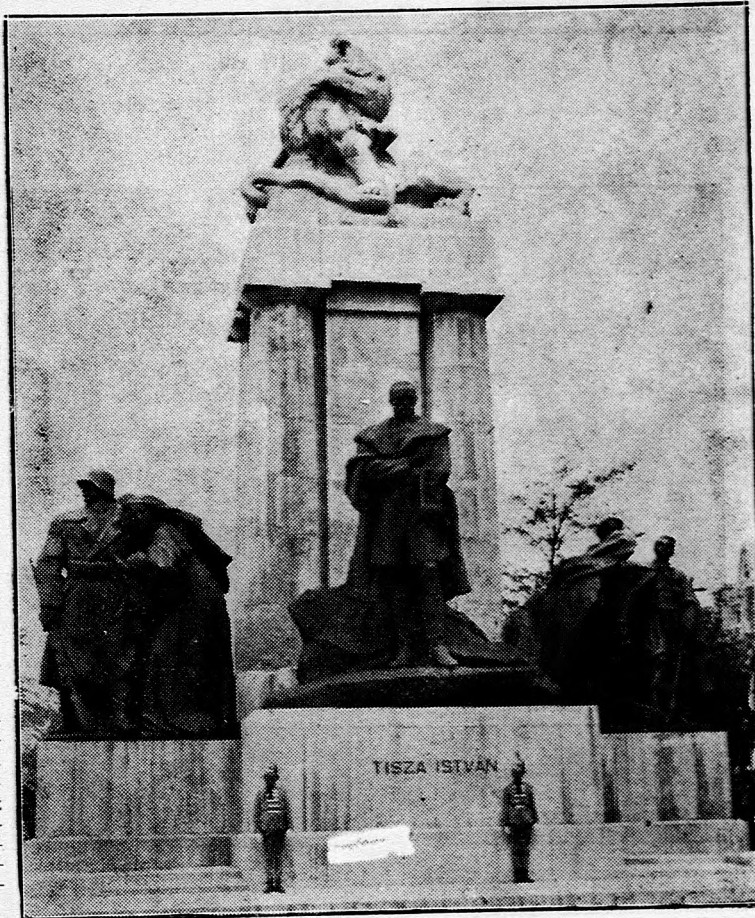
Tisza István szobra.

A debreceni Tisza István-tudományegyetem haláraitól küldött az egyházkerülethez azért, hogy az egyetem sértetlen fenntartása érdekében az egyház többször nagy nyomattékkal interveniált. Örömmel értesült a kerület közvéleménye