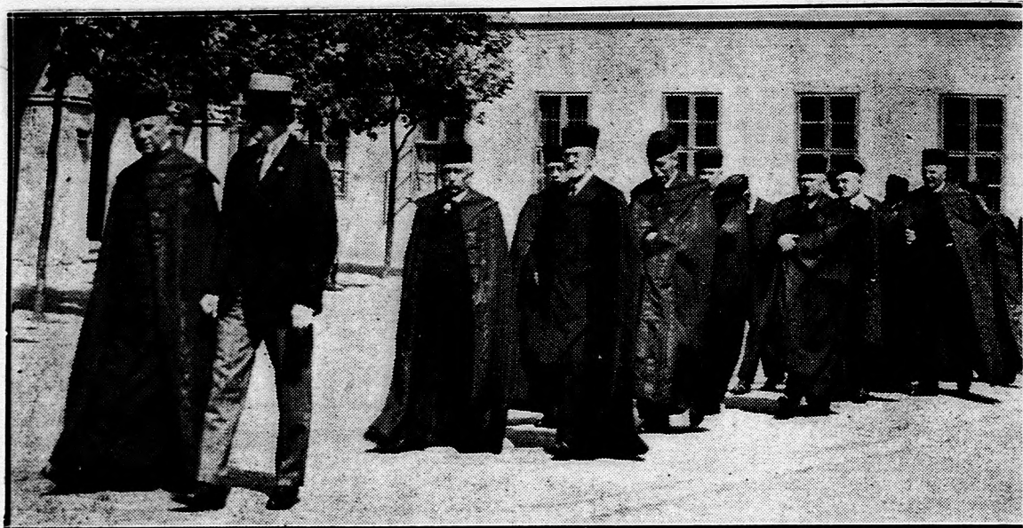
A közgyűlés tagjai a Kollégiumból a Nagytemplomba mennek.