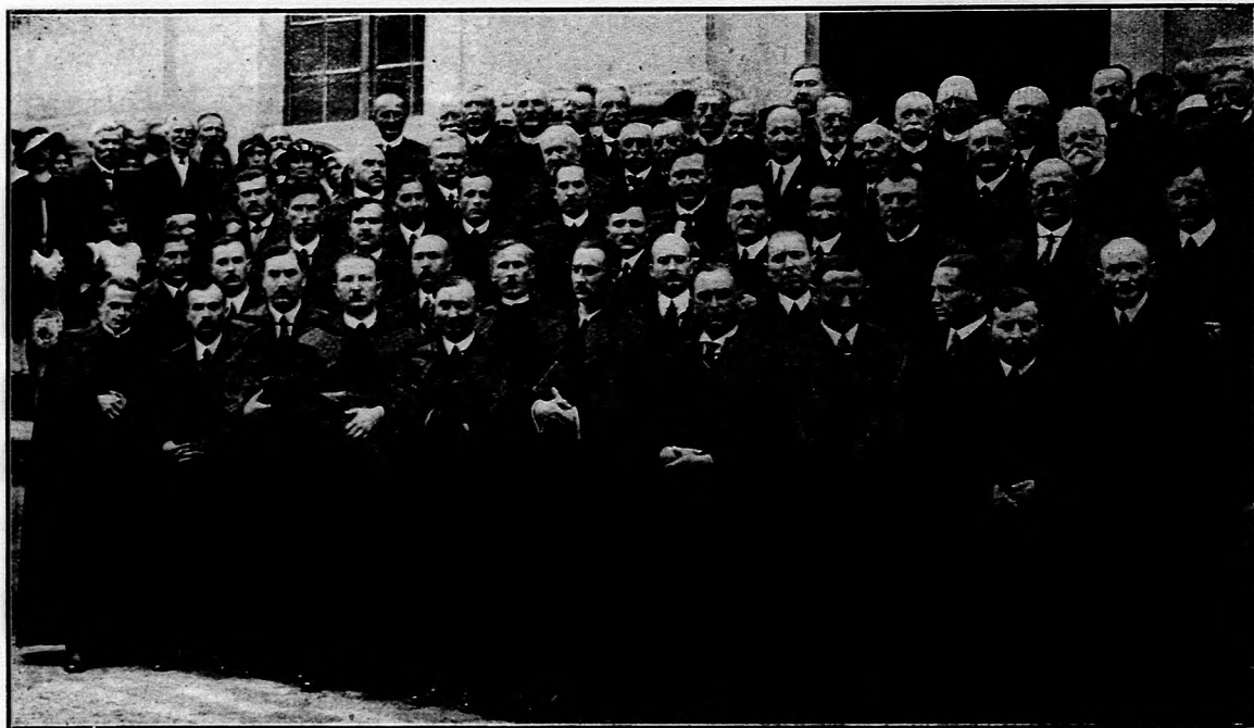
A felszentelt lelkészek.