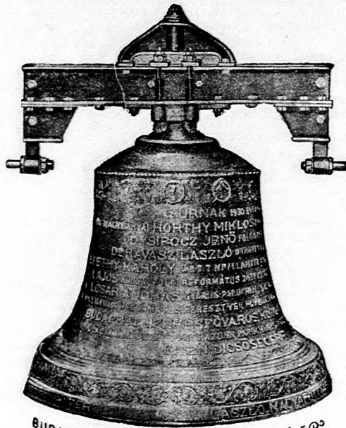
BUDAPEST-ANGYALFÖLDI REF. TEMPLOM RÉSZÉRE KÉSZÍTETT HARANG, MELYET DR. RAVASZ LÁSZLÓ PÜSPÖK ÚR AVATÓTT FEL.

Telefon: Aut. 913-53. sz. Költségvetéssel díjmentesen szolgál