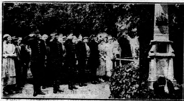
A Debrecenben időzött holland tisztek koszorút helyeznek a „Gályarabok Emlékoszlop”-ára.