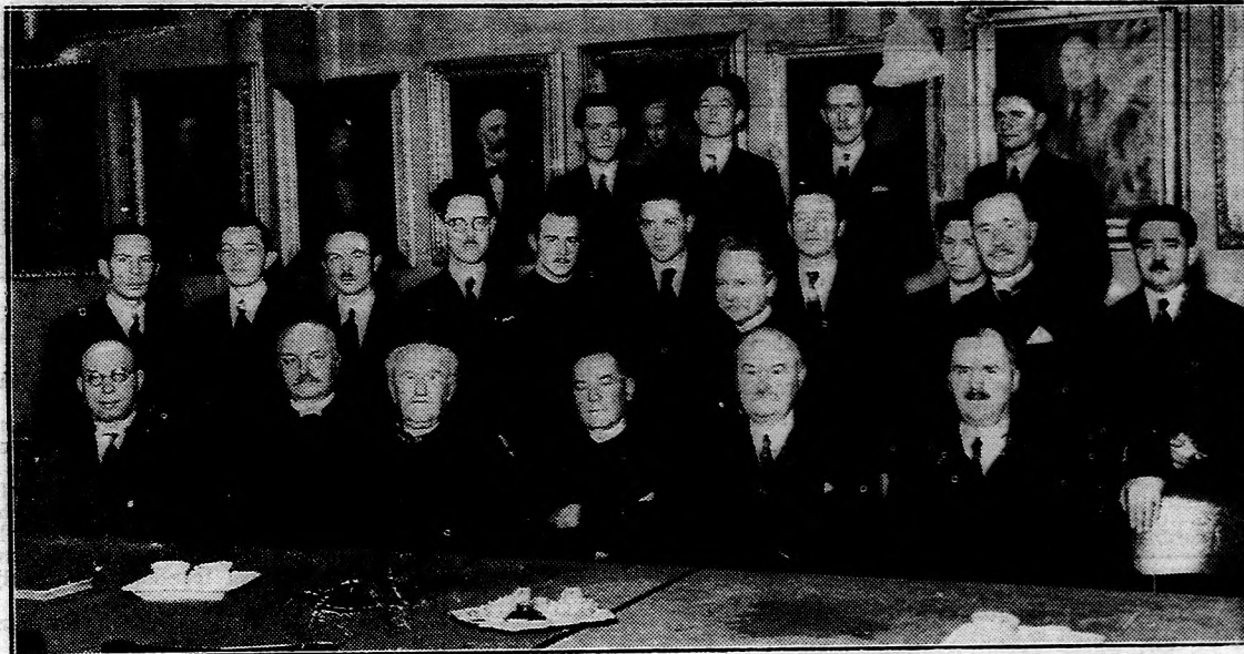
AZ I. LELEKÉSZKÉPESÍTŐ-BIZOTTSÁG ÉS A SIKERESEN VIZGÁZOTT SEGÉDLELKÉSEK