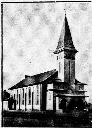
A nyilastelepi templom.