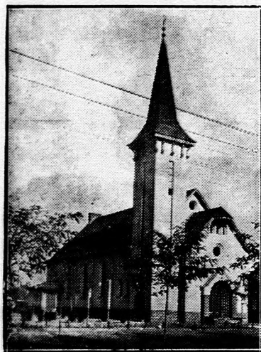
A homokkerti templom.

A homokkerti templomot november 10-én, a nyilastelepi templomot november 17-én, a kívül-belül renovált ősi Ispotály-templomot december