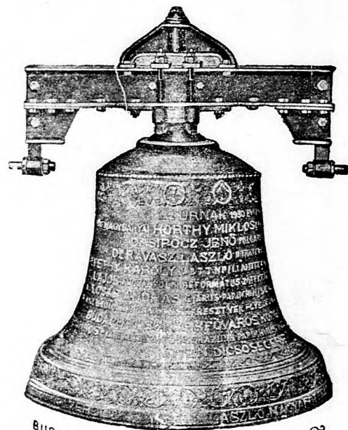
BUDAPEST-ANYALFÖLDI REF. TEMPLOM RÉSZÉRE KÉSZÍTETT HARANG, MELYET DR. RAVASZ LÁSZLÓ PÜSPÖK ÚR AVATÓJT FEL.

Előnyös fizetési feltételek. Számos egyházi elismerőlevél.