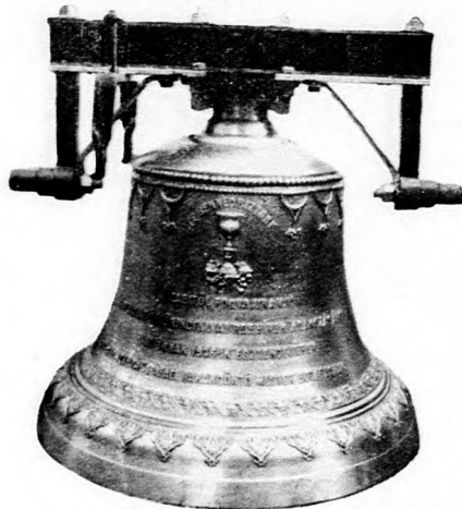
Garbolei református egyház harangja.

Készít: új harangokat, harang vaskoronákat és vasállványokat, repedt harangokat újra átönti legjutányosabb árak s kedvező fizetési feltételek mellett.