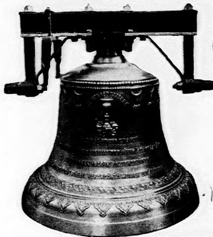
Garbolci református egyház harangja.

Készít: új harangokat, harang vaskoronákat és vasállványokat, repedt harangokat újra átönti legjutányosabb árak s kedvező fizetési feltételek mellett.