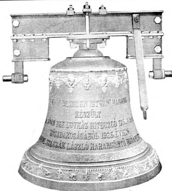
Fjándi református egyházközségnek szállított 598 kilogrammos „Gróf Bethlen István-harang”

Magyar gyártmányú zománc-edények, zsír-bödönök, disznóölő-kések, húsvágó-gépek