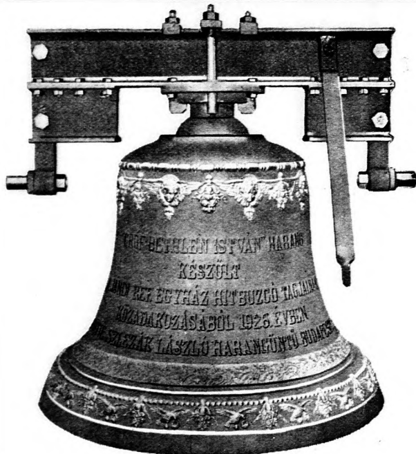
Jándi református egyházközségnek szállított 598 kilogrammos „Gróf Bethlen István-harang”

Magyar gyártmányú zománc-edények, zsír-bödönök, disznóölő-kések, húsvágó-gépek.