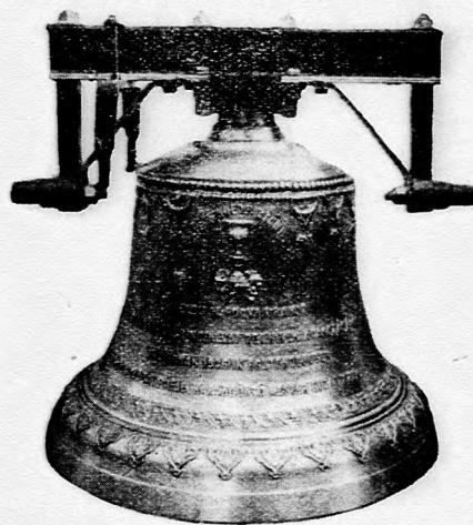
Garbolci református egyház harangja.

Készít: új harangokat, harang vaskoronákat és vasárványokat, repedt harangokat újra átönti legújanyosabb árak s kedvező fizetési feltételek mellett.