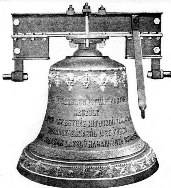
Jándi református egyházközségnek szállított 598 kilogrammos „Gróf Bethlen István-harang”

Magyar gyártmányú zománc-edények, zsír-bödönök, dísznőölő-kések, húsvágó-gépek.