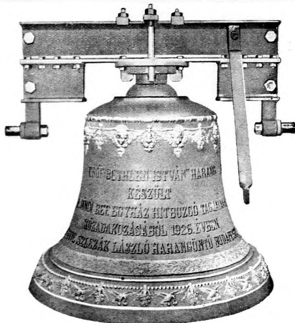
Jándi református egyházközségnek szállított 598,2 kilogrammos „Gróf Bethlen István-harang”

Magyar gyártmányú zománc-edények, zsír-bödönök, disznóölő-kések, húsvágó-gépek