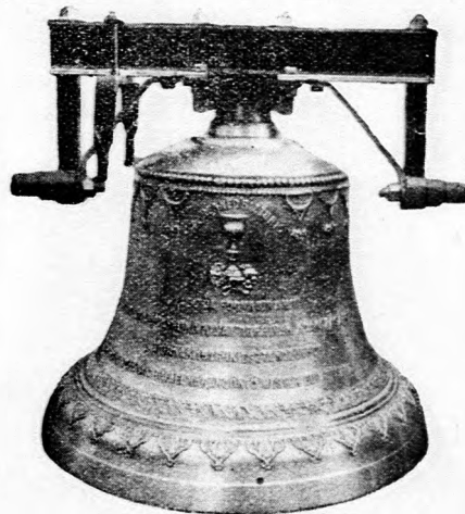
Garbolci református egyház harangja.

Készít: új harangokat, harang vaskoronákat és vas- állványokat, repedt harangokat újra átönti legjutá- nyosabb árak s kedvező fizetési feltételek mellett.