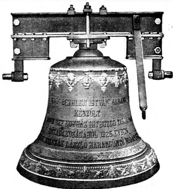
Jándi református egyházközségnek szállított 598 kilogrammos „Gróf Bethlen István-harang”

Magyar gyártmányú zománc-edények, zsír-bödönök, disznóölő-kések, húsvágó-gépek.