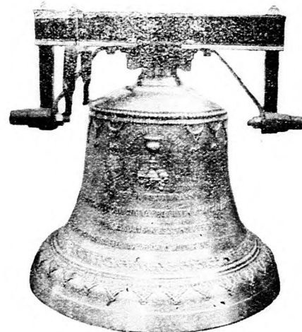
Garbocsi református egyház harangja.

Készít: új harangokat, harang vaskoronákat és vasállványokat, repedt harangokat újra átönti legjutányosabb árak s kedvező fizetési feltételek mellett.