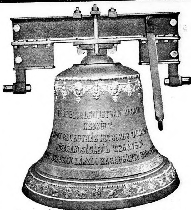
Jándi református egyházközségnek szállított 598 kilogrammos „Gróf Bethlen István-harang”

Magyar gyártmányú zománc-edények, zsír-bödönök, dísznövelő-kések, húsvágó-gépek.