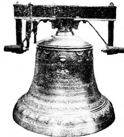
Garbóci református egyház harangja.

Készít: új harangokat, harang vaskoronákat és vasállványokat, repedt harangokat újra átönti legjutányosabb árak s kedvező fizetési feltételek mellett.