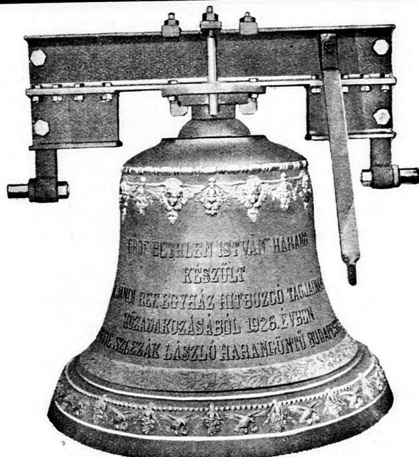
Jándi református egyházközségnek szállított 598 kilogrammos „Gróf Bethlen István-harang”

Magyar gyártmányú zománc-edények, zsír-bödönök, dísznölkő-kések, húsvágó-gépek.