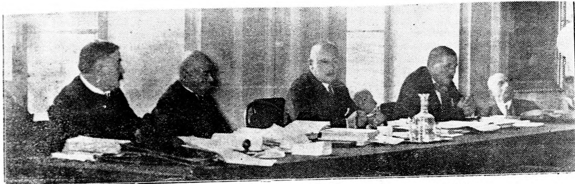
A TISZÁNTÚLI EGYHÁZKERÜLET KÖZGYŰLÉSÉNEK ELNÖKSÉGE.

Majd a továbbiakban szomorúan állapította meg a jelentés, hogy a mai életben egyre nagyobb hévvel lobban fel a felekezetieskedő gyűlölködés és vetélkedés lángja. Bekövetkezett az az állapot, hogy üresedésben levő állásokra és kereseti életpályákra első sorban felekezeti hovátartozás kvalifikál s legelső