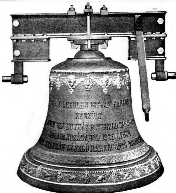
Jándi református egyházközségnek szállított 598 kilogrammos „Gróf Bethlen István-harang”

Magyar gyártmányú zománc-edények, zsír-bödönök, disznóölő-kések, húsvágó-gépek