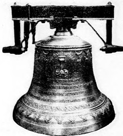
Garbolci református egyház harangja.

Készít : új harangokat, harang vaskoronákat és vas- állványokat, repedt harangokat újra átönti legjutá- nyosabb árak s kedvező fizetési feltételek mellett.