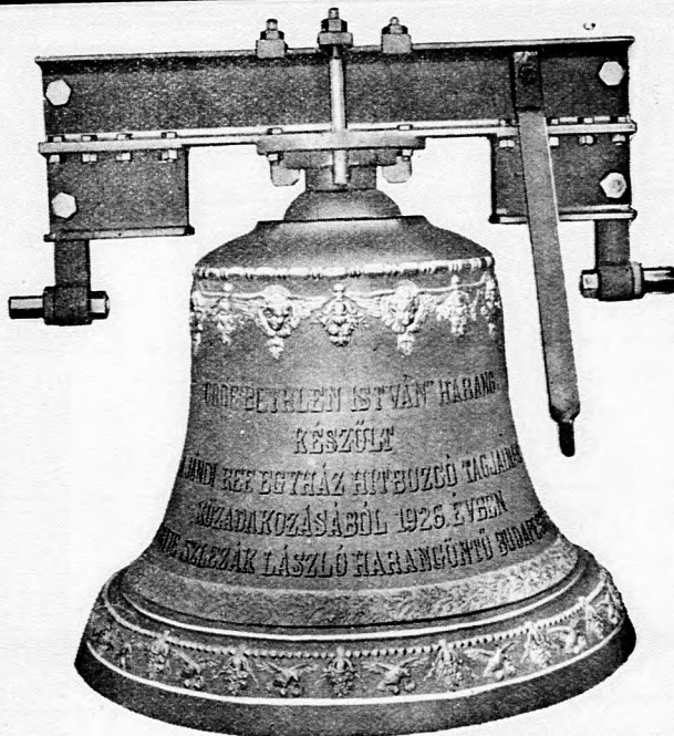
Jándi református egyházközségnek szállított 598 kilogrammos „Gróf Bethlen István-harang”

Magyar gyártmányú zománc-edények, zsír-bödönök, disznóölő-kések, húsvágó-gépek.